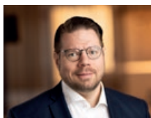
Ola Ranstam Group General Counsel